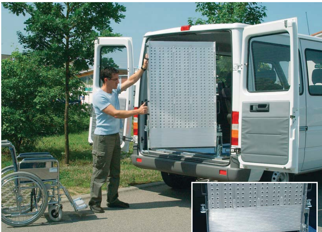
Andere Abmessungen auf Anfrage